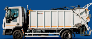
Cisterna za gorivo