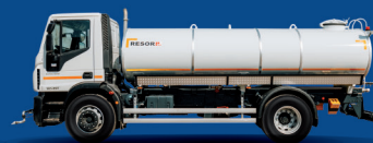
Cisterna za pitku vodu